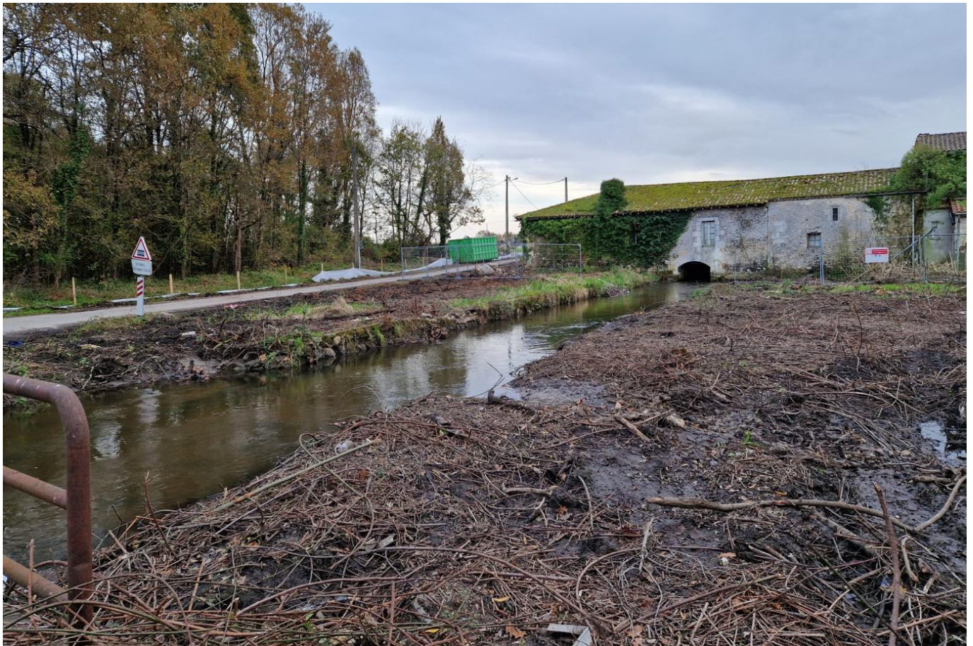
Le moulin Noir depuis Villenave d'Ornon , toute la végétation a été coupée, broyée.