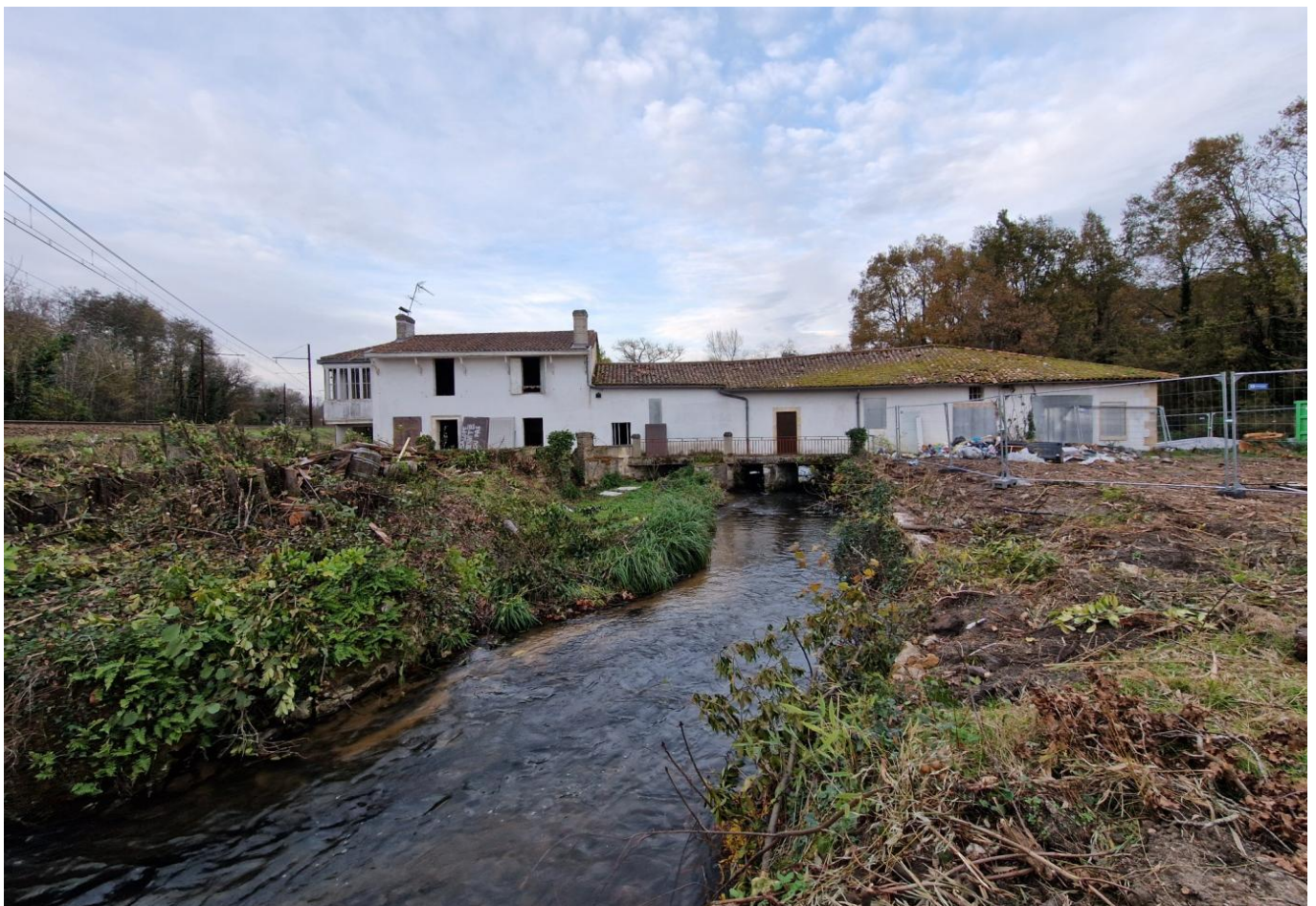
Le moulin Noir depuis Cadaujac avec la voie ferrée à gauche.