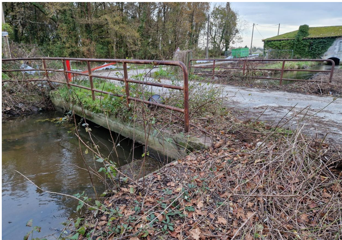
L'Eau Blanche ...